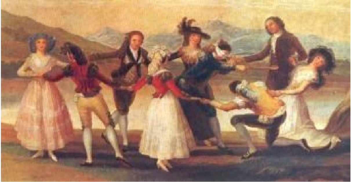
La gallinita ciega o el cucharón. Goya 1788 Museo del Prado. Madrid. (7)