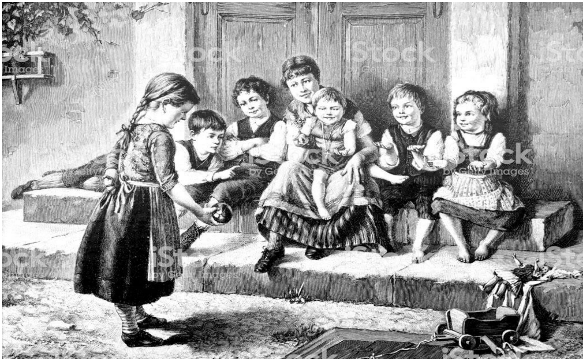
Los Niños Jugando en la Vereda. Año 1800. (1)

OBSERVA ESTAS IMÁGENES, SON FOTOGRAFÍAS DE RETRATOS, PINTURAS Y DIBUJOS.