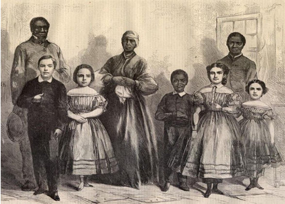
Niños Esclavos. América. Retratos. (3)