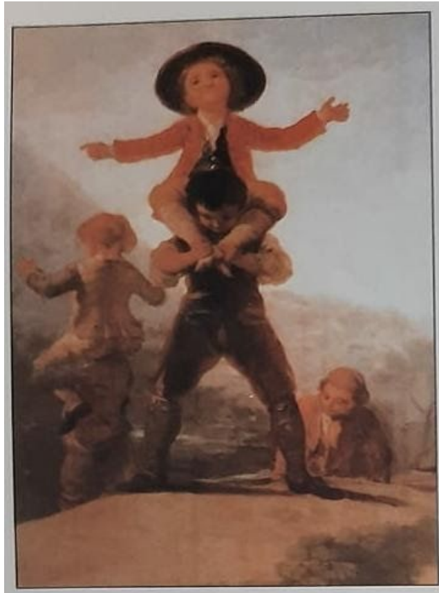
Francisco de Goya 1747- 1828. Las gigantillas. Museo del Prado.(9)

Francisco de Goya 1747- 1828. Niños inflando una vejiga. Museo del Prado. (8)