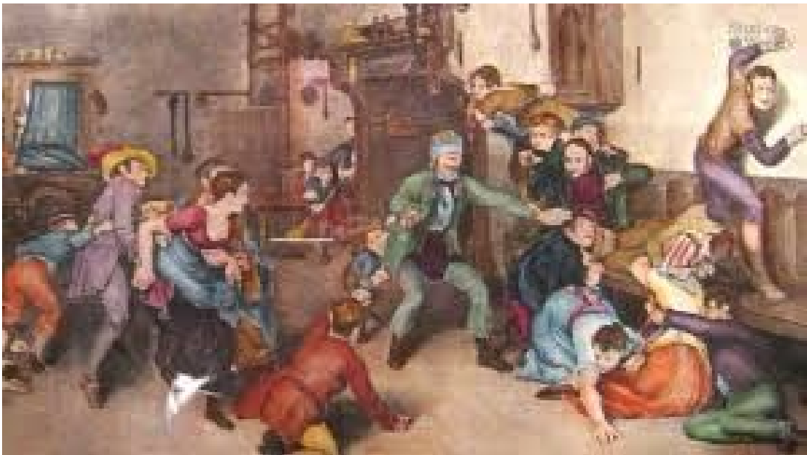
La Gallinita Ciega. (4)