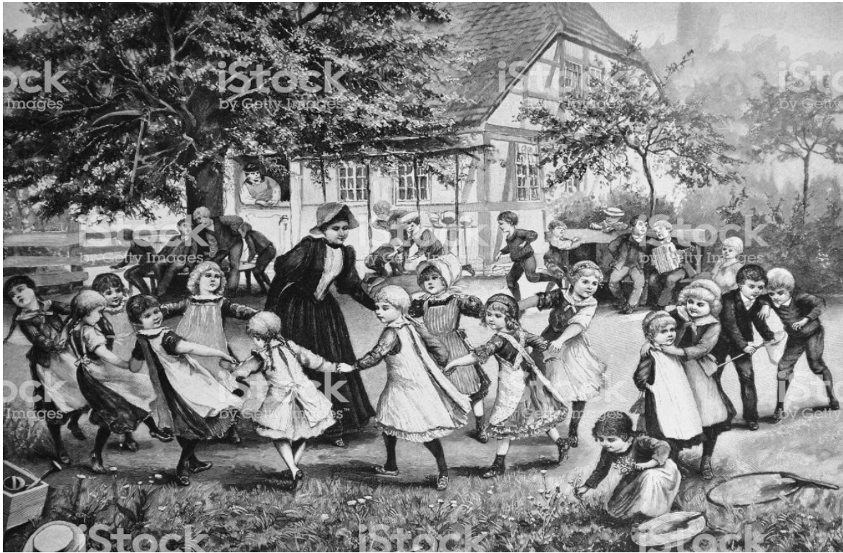
La Niños en ronda. Dibujo año 1800. (2)